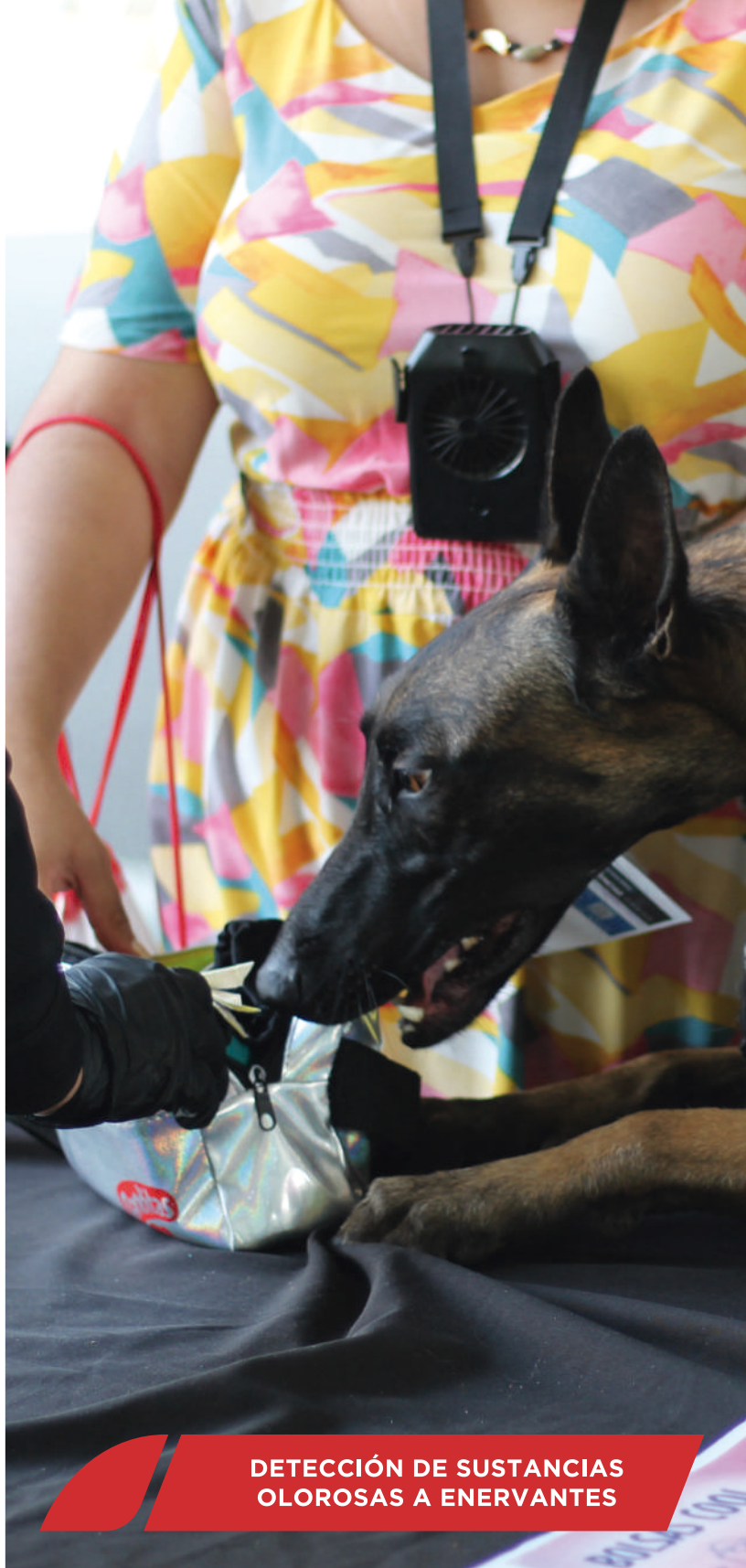
DETECCIÓN DE SUSTANCIAS OLOROSAS A ENERVANTES