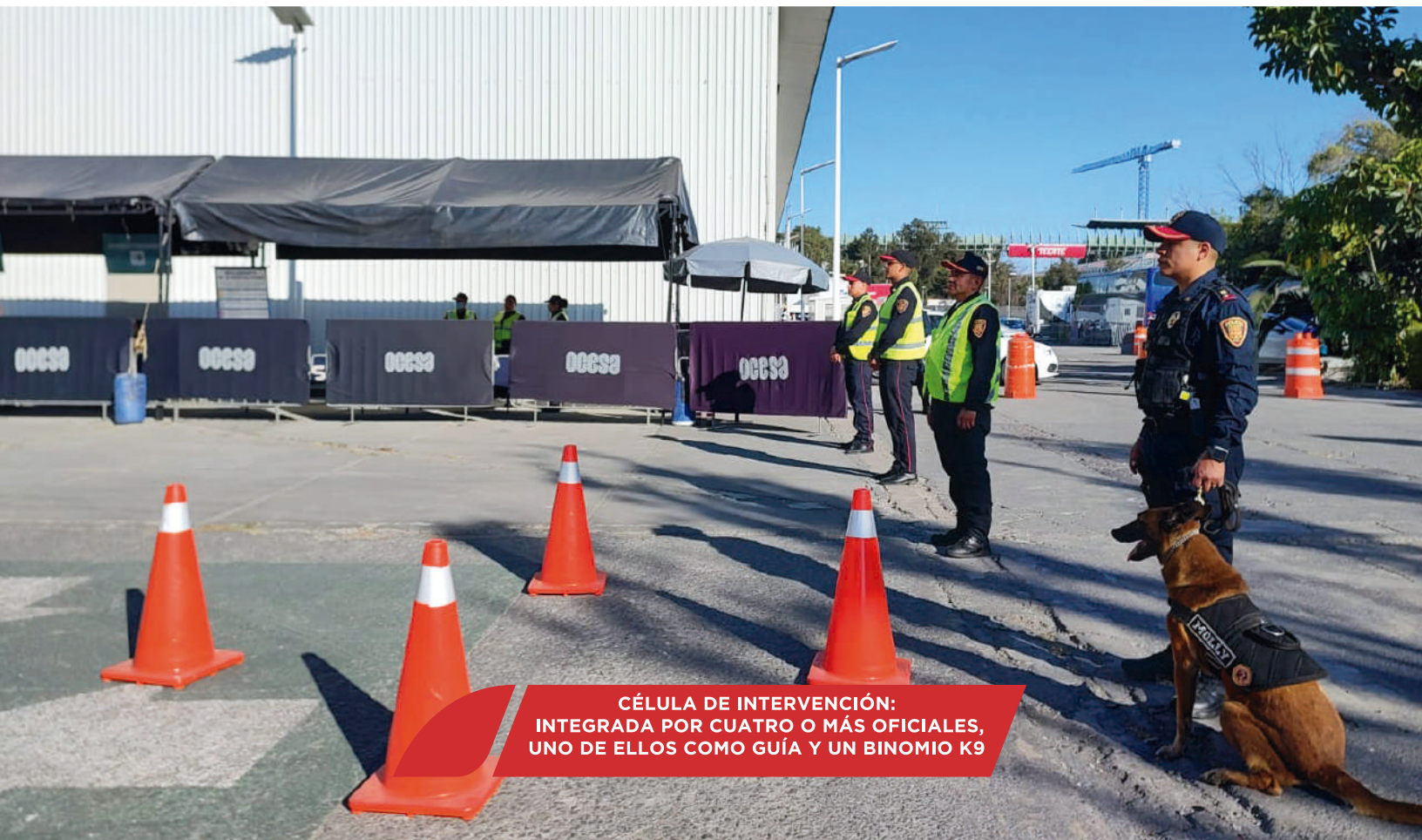
CÉLULA DE INTERVENCIÓN: INTEGRADA POR CUATRO O MÁS OFICIALES, UNO DE ELLOS COMO GUÍA Y UN BINOMIO K9