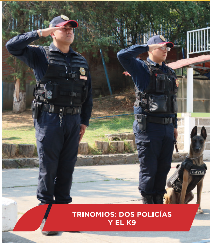
TRINOMIOS: DOS POLICÍAS Y EL K9