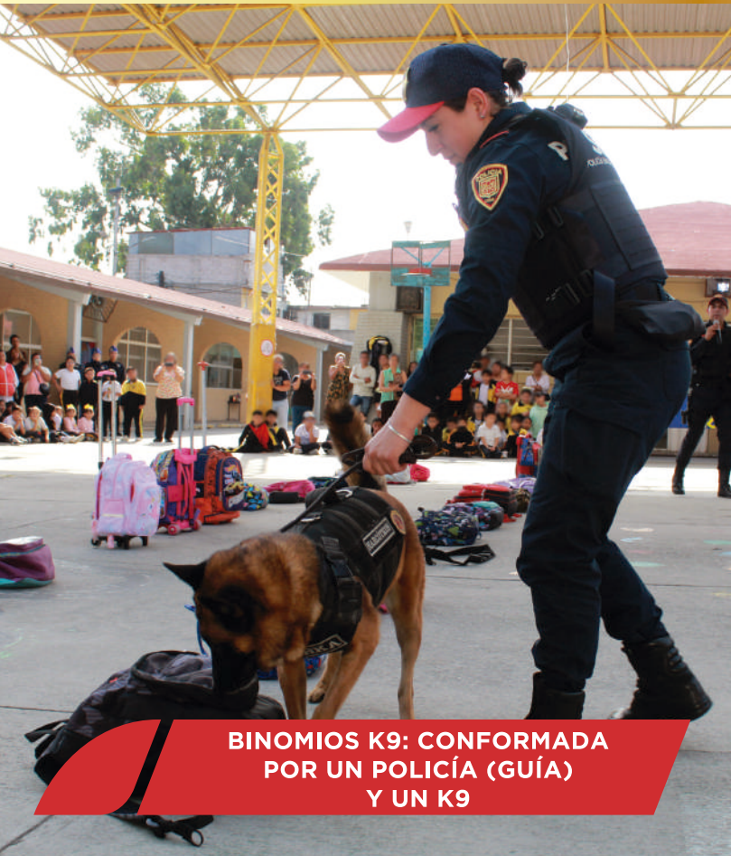
BINOMIOS K9: CONFORMADA POR UN POLICÍA (GUÍA) Y UN K9

Las modalidades que se pueden contratar son: