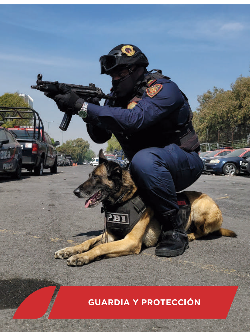
GUARDIA Y PROTECCIÓN